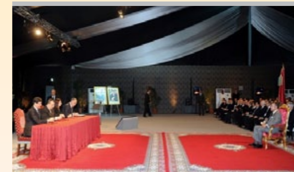
signature des conventions parachevant le cadre institutionnel de réalisation du projet intégré d'énergie électrique solaire